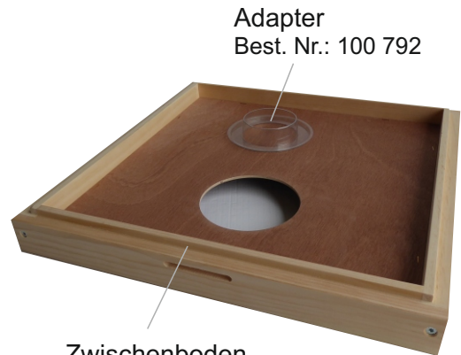
Adapter Best. Nr.: 100 792